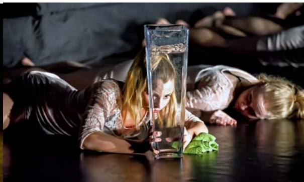
I HAVE A DREAM!