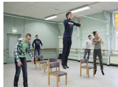
Ckv Eigenwerk vwo 4 - december 2013