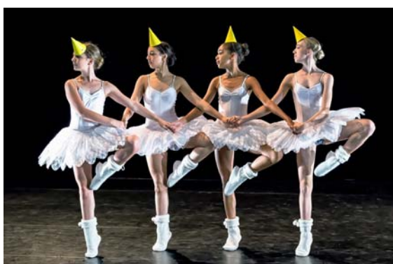
I HAVE A DREAM! 2014