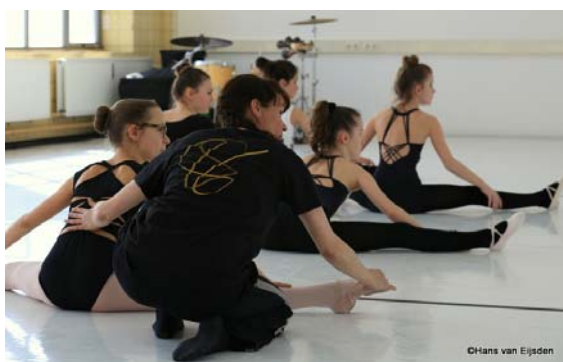
Talent on the Move Maastricht 2014