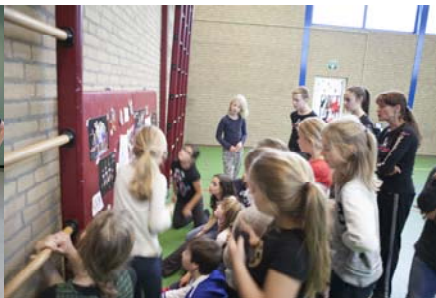
Dansinfo op BS de Keerkring